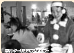
ホットケーキはいいかですかー

突然のサンタクロースの訪問に利用者様の笑顔と拍手が沸きました。スタッフによる手作りホット