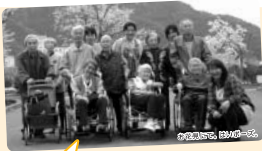
お花見にて。ほいほーズ。

桜の舞う季節…今年には長良公園へお花見に行きました。黄砂、風と雨、そんな天気とにらめっこしながらでしたが、野外で食べるお弁当は、やっぱりおいしいですね。(^^)