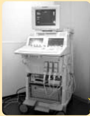
最新式の心臓用超音波装置です

数の専用パソコンで閲覧できる為、主治医は患者様の検査結果をいち早く把握することで迅速な対応へと繋がっています。さらに血液データ等の検査結果を用紙に印刷してお渡し、患者様御本人における健康管理に役立てて頂きます。当院のこのようなシステムをMWS(メディカルワークステーション)といい、将来の電子カルテ化やフィルムレス撮影した画像をフィルムに出さずパソコンの高精細モニターで診断するのに対応できるようになっています。