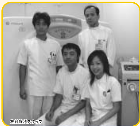
放射線科スタッフ

当科では様々な検査装置を用いて画像情報を提供し、今日の診療に役立てています。現在4名の診療放射線技師が従事しており、日進月歩の医療現場で常に最高の技術と知識を提供すべく日々努力しています。検査を通じて患者様と関わり合える時間は長くありませんが、ふれあいを大切にし親切で分かり易い説明を心掛けておりますので、検査に対する疑問、質問等がございましたら御気軽に声をかけて下さい。