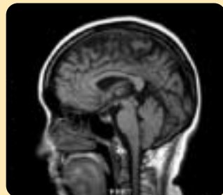
頭部MRIです。縦断面画像も簡単に撮影できます。

当院ではレントゲン写真CT・MRI画像、超音波画像、心電図、血液データ等をコンピュータでデジタル管理している為、画質の低下を伴わずに長期保存が可能となっております。またその情報は院内ネットワークを介して複